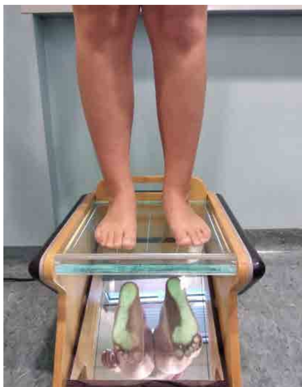
Figura 3. F.G: controllo all'età di 14 anni.