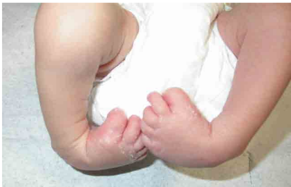
Figura 2. F.G: quadro clinico alla nascita.