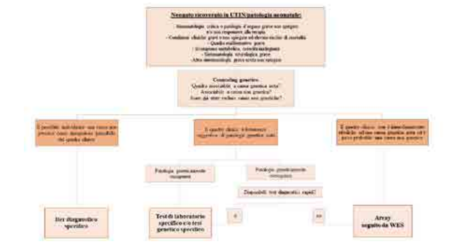
FIGURA 1. Algoritmo diagnostico nel neonato con sospetta patologia genetica, ricoverato in terapia intensiva neonatale (tradotto e modificato da Borghesi A. et al)[17].

diagnostico riguardante specificatamente l'ambito neonatale.